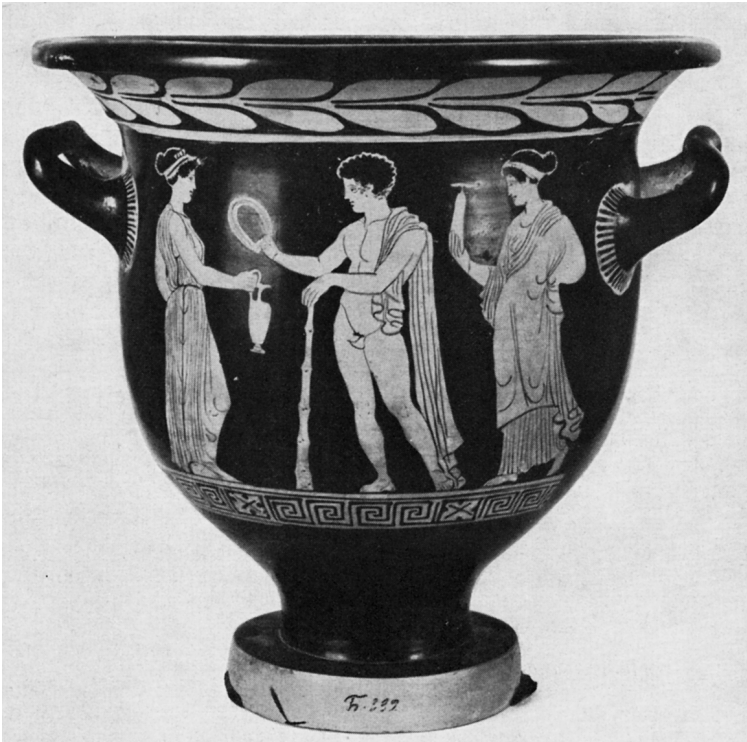
Abb. 2 Frühitaliotischer Glockenkrater in Leningrad