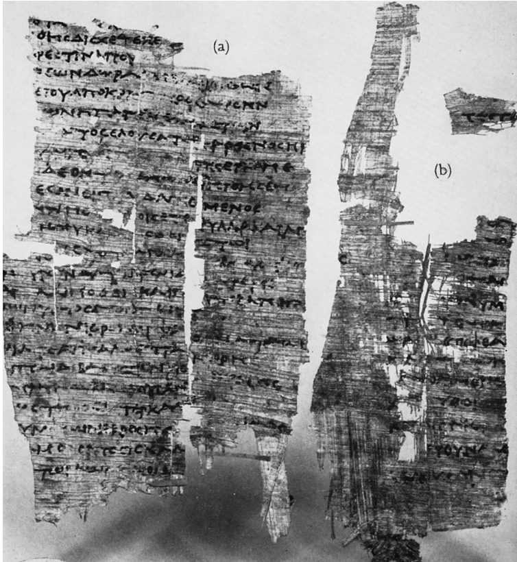
Pl. 2: P. Brit. Mus. Inv. 589 recto