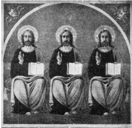
Zu S. 180

sind auf lykischen Münzen wie gekrümmte Radspeichen gestaltet, sonst meist als menschliche Beine, und zwar ins Knie gestützt wie zum schnellsten Lauf, so zB. in den zahlreichen Prägungen von Aspendos 1 ; auf Silbermünzen von Syrakus wird das Bild der Schnelligkeit durch Flügel an den Fersen verstärkt. Ueberblickt man die überlieferten Typen, wie mir das an den Abgüssen Imhoof-Blumers möglich war, und beachtet man, dass die lykischen Münzen 2 jenes Kreisrund regelmässig mit einer Oeffnung dh. Nabe, gelegentlich auch einem Bolzen dh. Achse darstellen und vielfach vier Speichen statt dreier geben, so verschliesst man sich schwer dem Eindruck, dass diesem Dreibein eine Vorstellung des Sonnenrads zu Grunde liegt; apotropäische Kraft konnte nach dem Donnerkeil kein Zeichen in höherem Maasse besitzen als das Symbol der Lichtquelle.