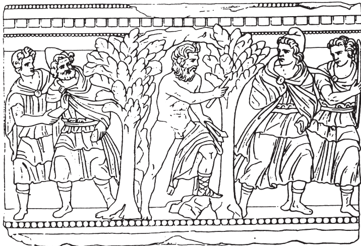
Abb. 1. Reliefdarstellung einer etruskischen Aschenkiste aus Volterra (Florenz, Museum Guarnacci 332. Umzeichnung nach H. Brunn)

rechten zwei Männern entgegen 63 ), die sich auf der rechten Reliefseite befinden. Von den beiden unbärtigen, jugendlich aussehenden Männern, die in ein aufgebundenes Untergewand gekleidet sind, dazu einen Umhang 64 ) und kurze Stiefel tragen, hat der vordere, dem Bärtigen am nächsten stehende, eine phrygische Mütze auf, der andere hält einen Schild, der die Bildkomposition rechts abschließt. Beide sind dabei, sich zum Gehen zu wenden; nur die Rückwendung der Köpfe hält den Bezug zu der Figur in der Bildmitte aufrecht. Dagegen unterstreichen der in den Mantel eingeschlagene rechte Arm des Mannes mit der Mütze und die an den Schild greifende Hand seines Begleiters die von der Reliefmitte fortdrängende Bewegung dieser Figurengruppe. Den beiden Jünglingen auf der rechten Bildseite korrespondiert links eine Zwei-Figuren-Gruppe, bestehend aus einem älteren Manne mit kurzge-