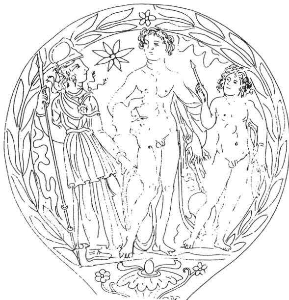
Abb. 2. Etruskischer Bronzespiegel (Museum für Vor- und Frühgeschichte Frankfurt. Umzeichnung nach U. Höckmann)

weiteren zeigt das Urnenrelief aus Volterra einen Odysseus, der sich gedrängt fühlt, in das von ihm belauschte und vor seinen Augen sich abspielende Geschehen einzugreifen. Auf der rechten Bildseite wenden sich die Troer zum Gehen, und es fragt sich, ob