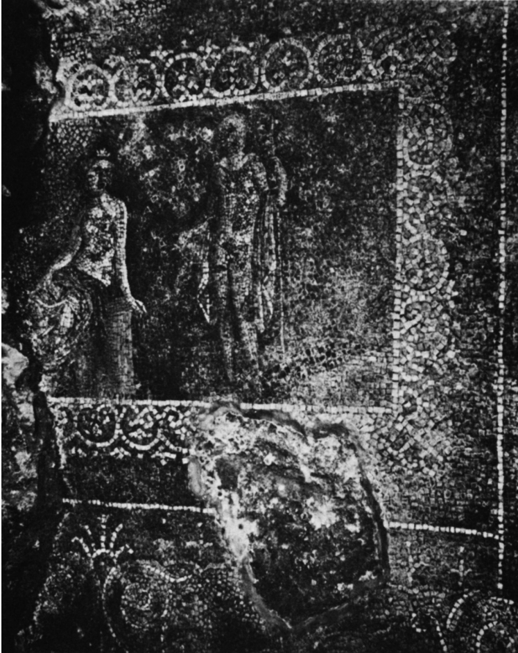
Io und Argos. Römisches Wandmosaik neronisch-flavischer Zeit (Quirinal).