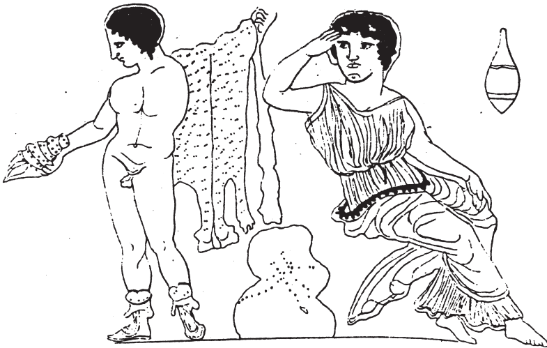
Krater der Sammlung Biscari, Catania (verschollen)

Auch für Argos gilt zunächst einmal das gleiche wie für Io. Hauptvorlage ist der Bildtypus, der auf das Werk des Nikias zurückgeht. Ihm verdankt der Argos des Mosaiks seine Konzeption als heroischer Ephebe mit Mantel und Speer statt mit Keule und Pantherfell 21 ). Auch in der Anordnung dieser Ausstattung (der