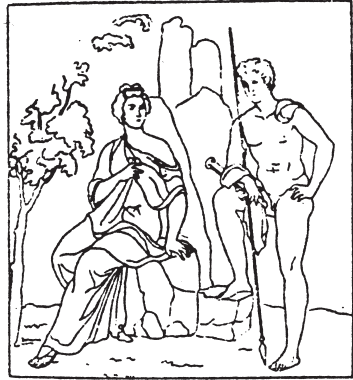
Casa di Meleagro in Pompeji (Neapel)