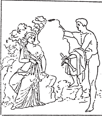
Macellum in Pompeji

zwei zierliche Hörnchen über der Stirn übriggeblieben, und selbst dieses theriomorphe Relikt hat sich zu einem bloßen Zierat im Stirnhaar verflüchtigt 7) . Und was Argos betrifft, so ist aus dem dämonischen Wesen mit Doppelgesicht oder augenübersättem Körper oder dem ungeschlachten, bärtigen Manne, wie ihn die Vasenmalerei der spätarchaischen und frühklassischen Zeit kennt 8) , ein wohlgestalter Jüngling geworden. Beide Entwicklungen setzen bereits in der Kunst der zweiten Hälfte des 5. Jahrhunderts ein, bei Io etwas früher, bei Argos etwas später 9) . Die verän-