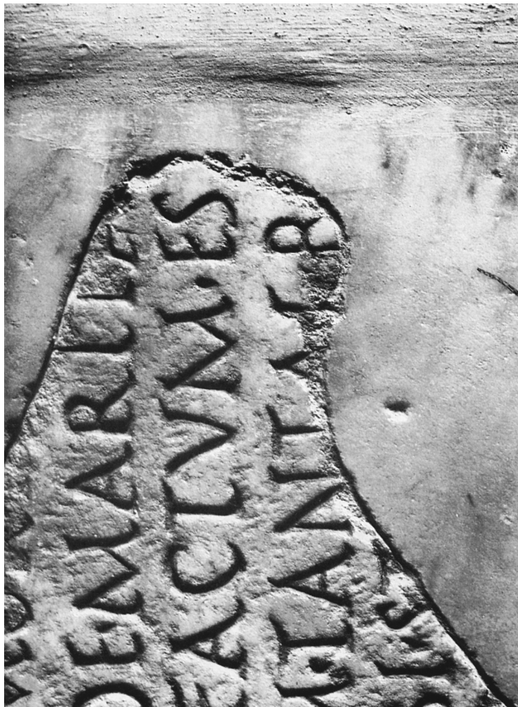
Fig. 3. Particolare della Fig. 2.