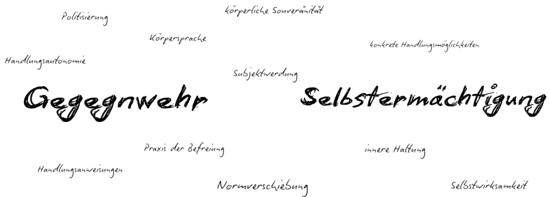
Abbildung 4: Kodierdiagramm – Gegenwehr und Selbstermächtigung. Eigene Darstellung.